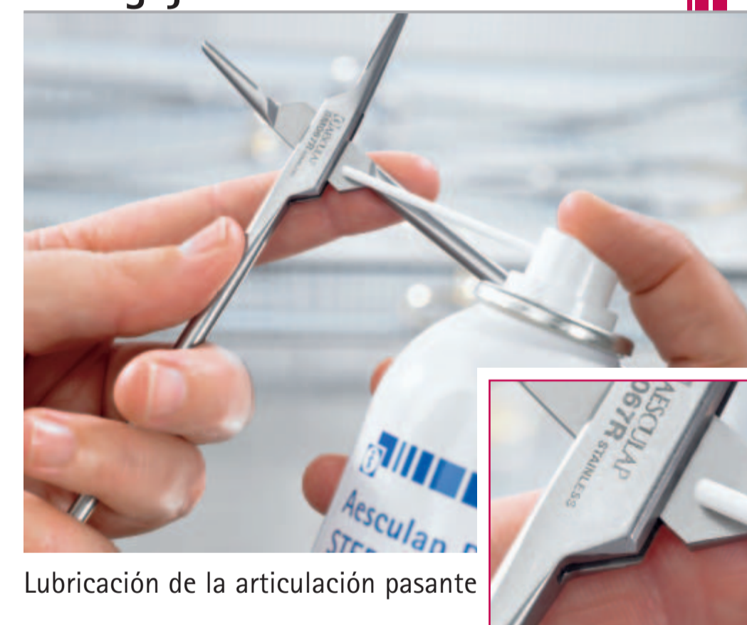
Lubricación de la articulación pasante