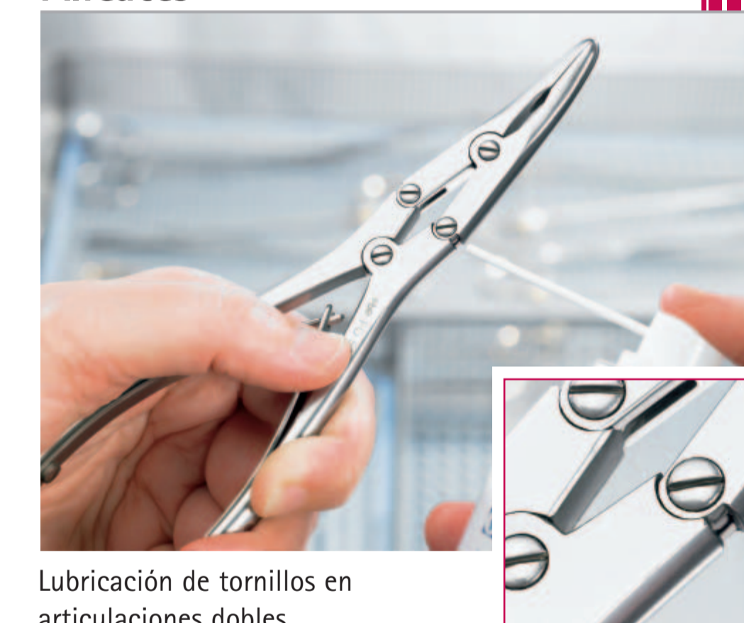
Lubricación de tornillos en articulaciones dobles