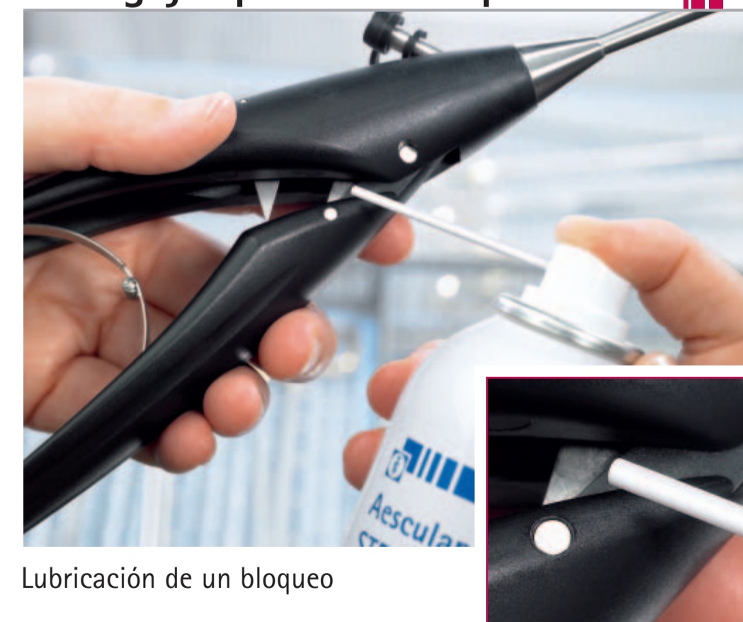
Lubricación de un bloqueo