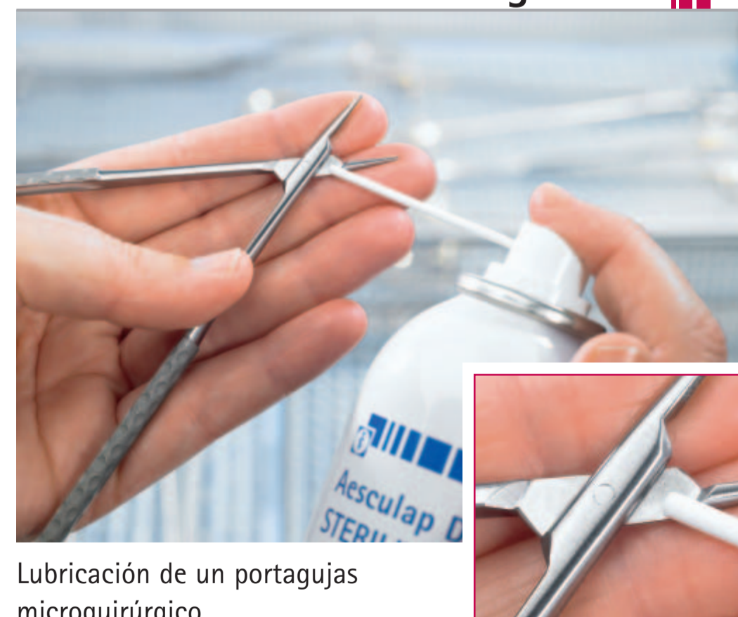
Lubricación de un portagujas microquirúrgico