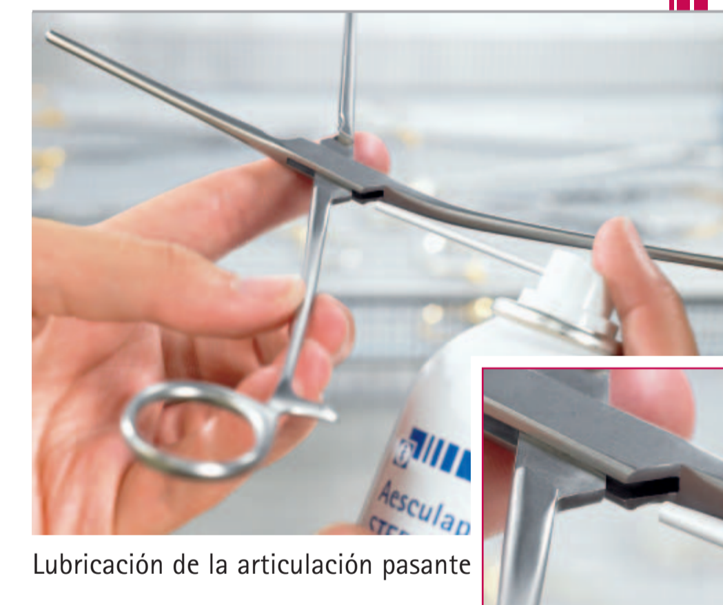
Lubricación de la articulación pasante