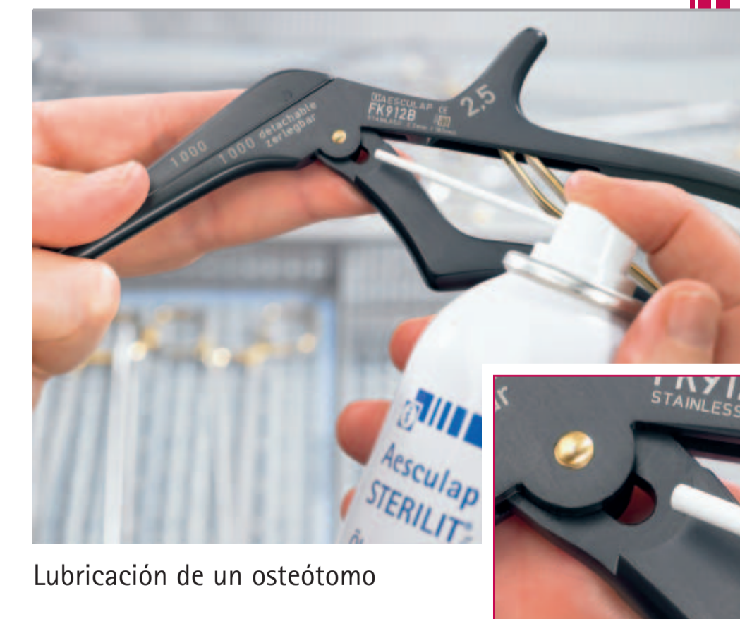
Lubricación de un osteótomo