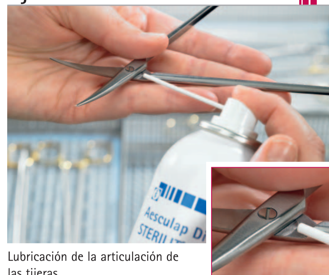
Lubricación de la articulación de las tijeras