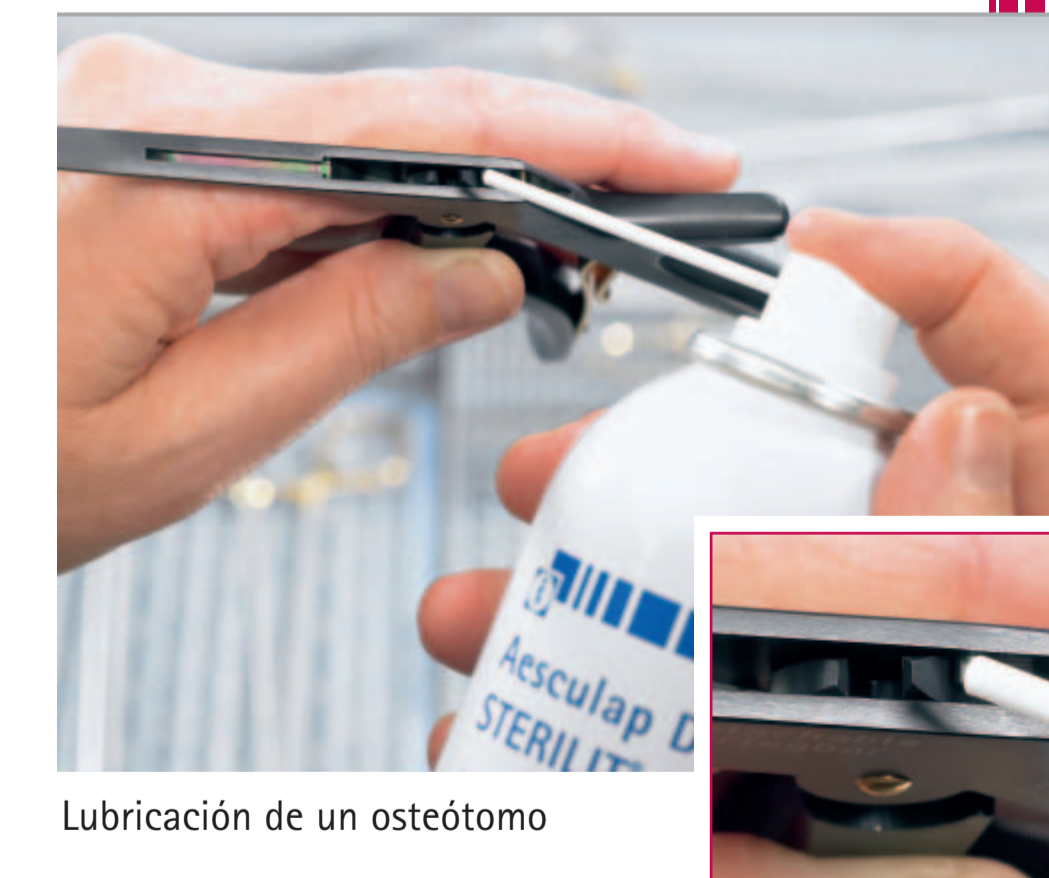
Lubricación de un osteótomo