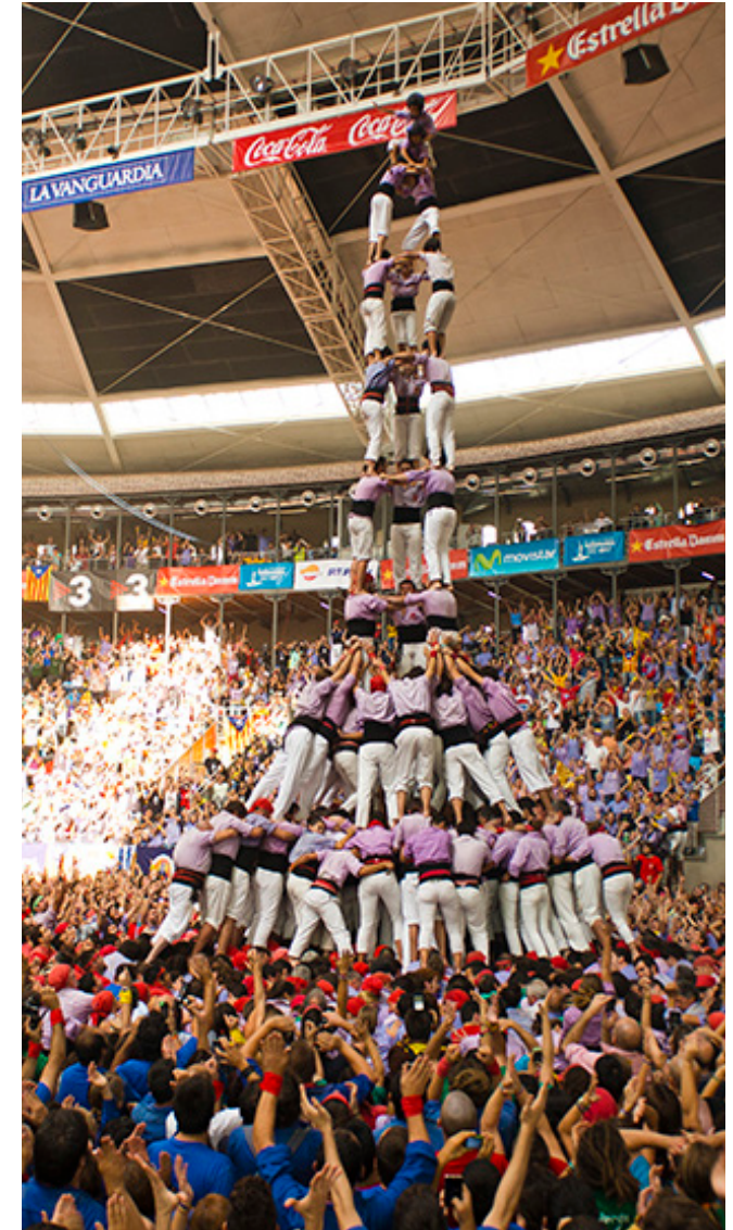
Visita a la Colla jove dels Xiquets de Tarragona