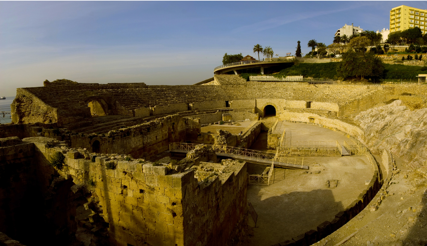
Ruta por la Tarragona Romana