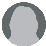
Rafaela Camacho Bejarano